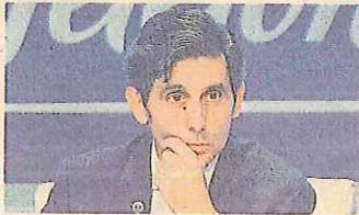
José María Álvarez-Pallete, presidente de Telefónica.

Telefónica ha anunciado que estudia acciones legales contra el Gobierno argentino de Mauricio Macri por permitir que el Grupo Clarín pueda entrar en condiciones ventajosas en la telefonía móvil, mientras se retrasa la llegada de Telefónica al mercado de la TV de pago. P5/LA LLAVE